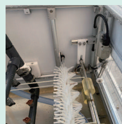
ノズル・スパイラルブラシ