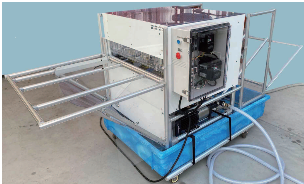
(パネル受台・水受けはオプション) 特許第6325899号